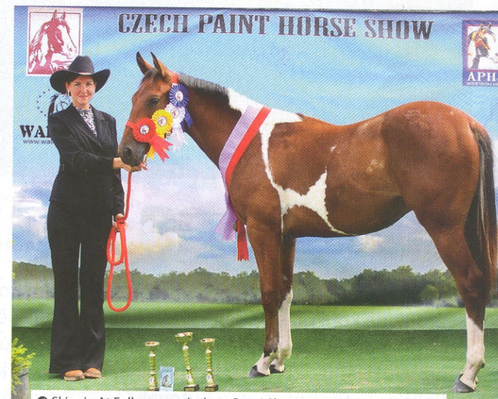
Skippin At Fullmoon, valach po Pepsi Skippin Scotch, získal při svém prvním startu titul Reserve Champion mezi valachy na letošní Paint Horse Show.

Ale ať už bude umístění či sláva potomků buckskin tobiana Pepsi Skippin Scotch jakákoli, jedno je jisté – příběh jejich otce má happy end. Kdo ví, třeba i to se předává v genech.