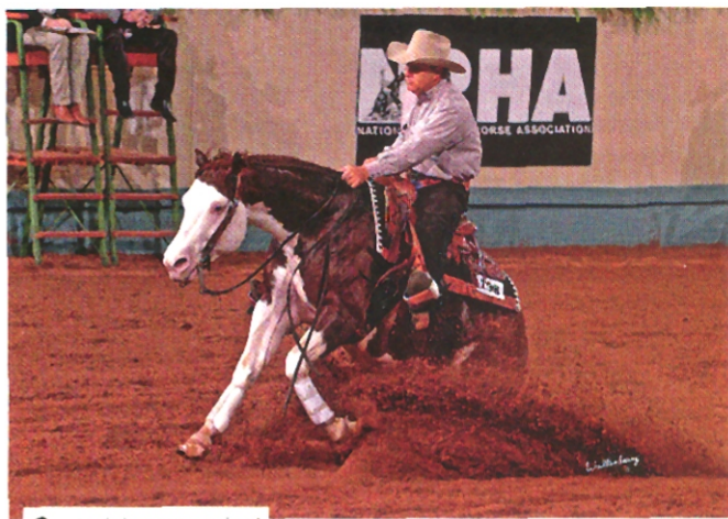
... i reiningovou arénu!

s anglickým plnokrevníkem pro účely dnes tak moderních anglických disciplín – nejsou výjimkou koně s výškou i hodně přes 160 cm. Proto platí, že původně širokoplecí osvalení „puclíci“ na krátké holeni stojí dnes v registru bok po boku s jedinci štíhlými, dlouhokrkými, na první pohled stěží rozeznatelnými od plnokrevníků.