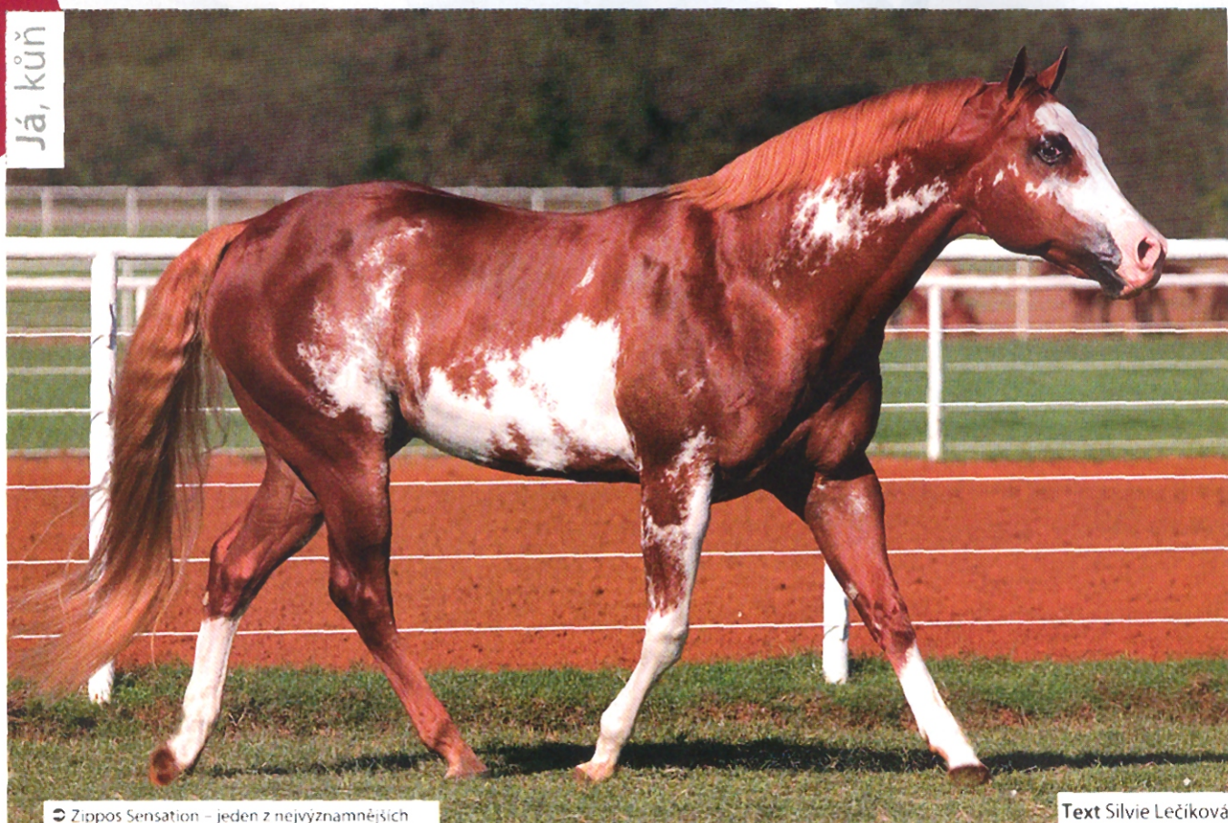
➔ Zippos Sensation – jeden z nejvýznamnějších moderních plemenů plemene paint.